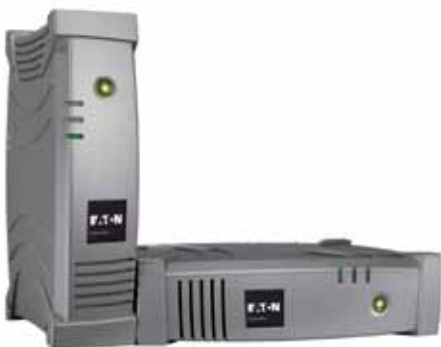
Univerzálnost Eaton Ellipse MAX