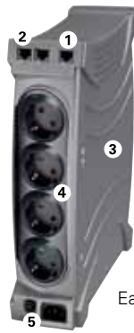
Eaton Ellipse MAX 600