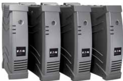
Řada Eaton Ellipse MAX