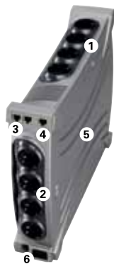
Eaton Ellipse MAX 1500